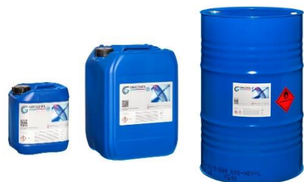
5, 20, 200 Liter sowie 1000 Liter IBC auf Anfrage